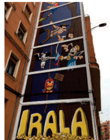
#Irala100Urt Mural diseñado por Enrique Gato, realizado por AmiarTE Bilbao con el apoyo del Ayto de Bilbao.