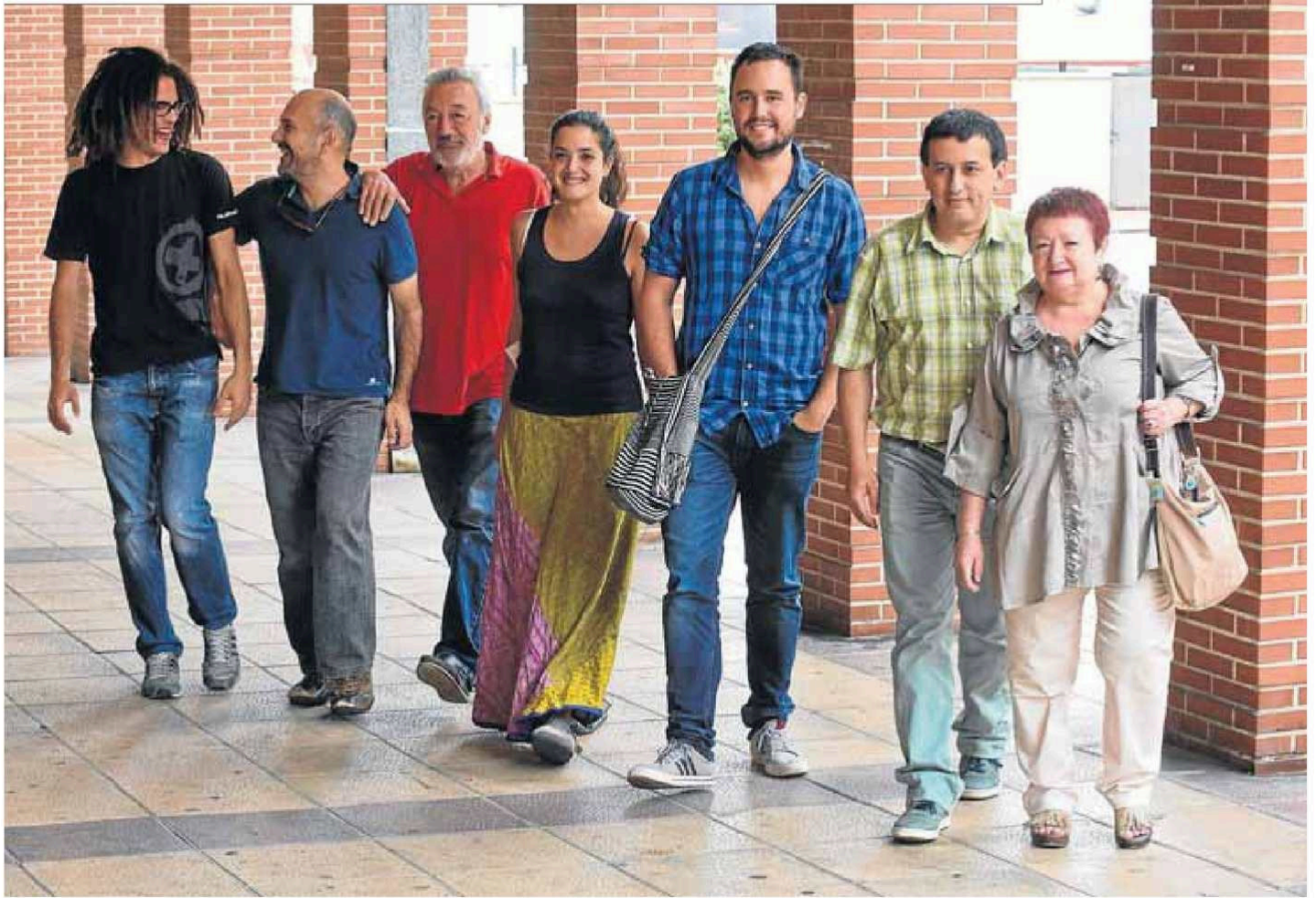
Diferentes agentes que forman parte del día a día del bilbaino barrio de Irala.